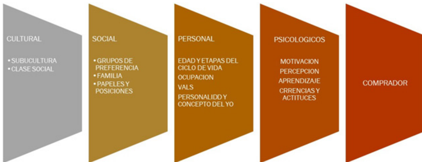
Figura 1. Factores de decisión propuestos por Philip Kotler (Ciribeli y Miquelito, 2015).

y Miquelito, 2015), como uno de los autores que relaciona de manera directa la caracterización del consumidor frente a la decisión de compra, en la Figura 1 se proyecta los componentes de análisis.