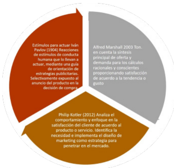
Figura 2. Comercialización.

Y con respecto a la comercialización de acuerdo a los aportes que se describen a continuación en la Figura 2.