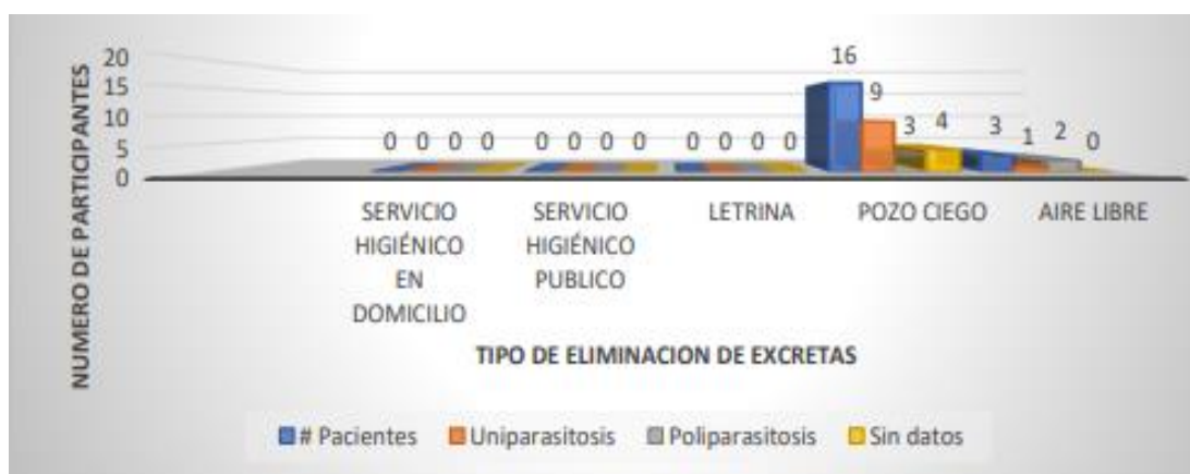
Gráfico 2. Eliminación de excretas con relación a cantidad de enteroparásitos identificados en coproparasitológico de niños menores de 5 años.

La mayor parte de los niños consume agua directamente de la fuente de agua, pero a la par en este grupo existe mayor grupo de niños con uniparasitosis.