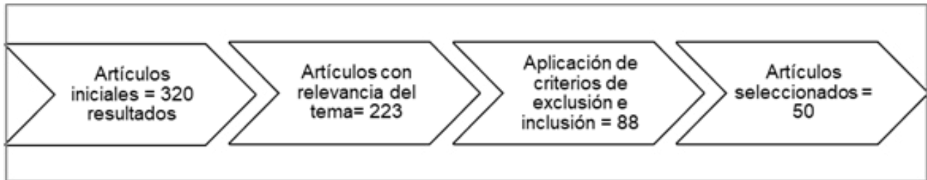
Figura 1. Proceso de selección de las fuentes consultadas.

de plazo; obteniendo 88 artículos, de los cuales se escogieron 50 artículos sobre los aspectos de las actitudes del docente en la educación inclusiva (Figura 1).