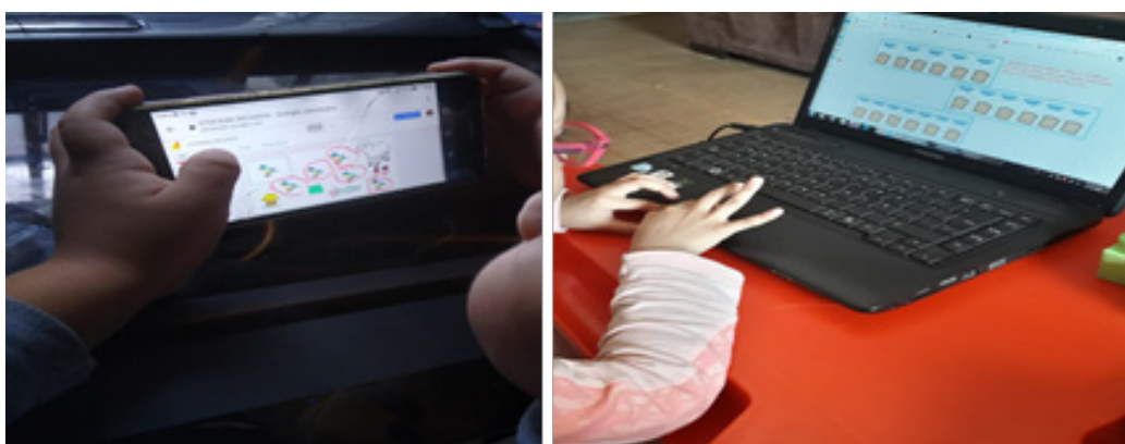
Figura 2. Uso del celular y laptop por infantes de 5 años durante la etapa de aplicación del programa con el uso del Jamboard.

de la aplicación Jamboard y en la Figura 4 los materiales básicos para desarrollar la noción de seriación, relación y cardinal-cantidad.