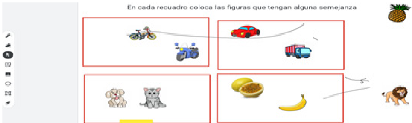
Figura 3. Uso del Jamboard para desarrollar la noción de clasificación.