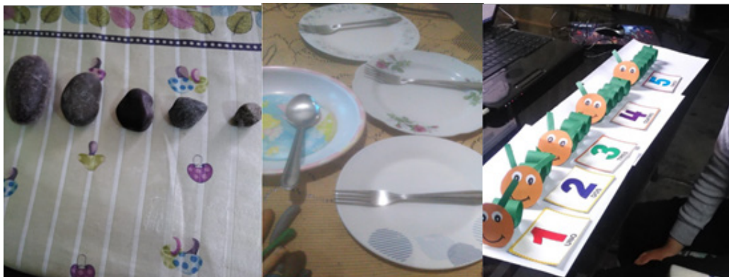
Figura 4. Uso de materiales concretos para desarrollar la noción de seriación, relación y cardinal-cantidad.