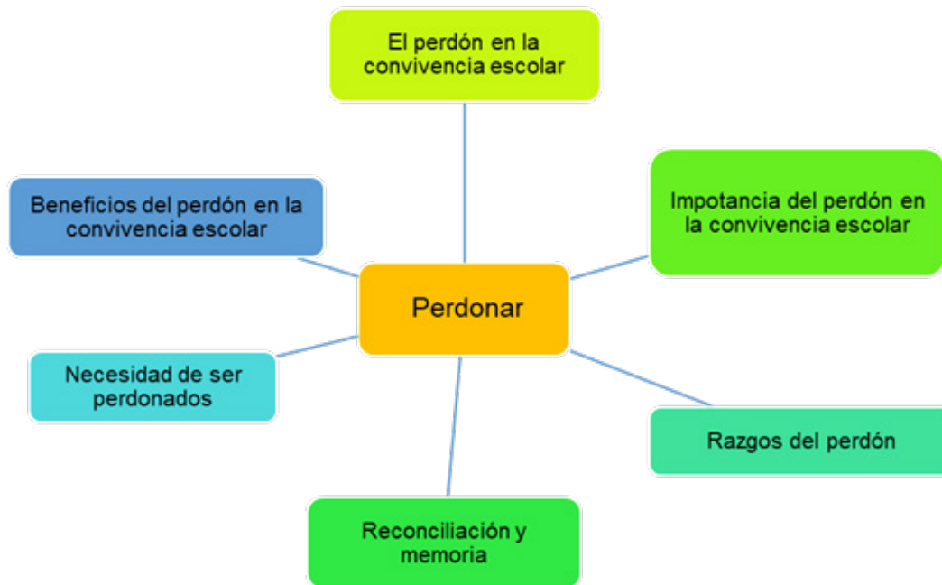
Figura 3. Aspectos relevantes sobre el perdón en la convivencia escolar.

12% al 2019 y solo el 8% al 2018. Como se observa la mayor parte de los artículos sistematizados sobre el perdón en la convivencia escolar, son relativamente actuales.